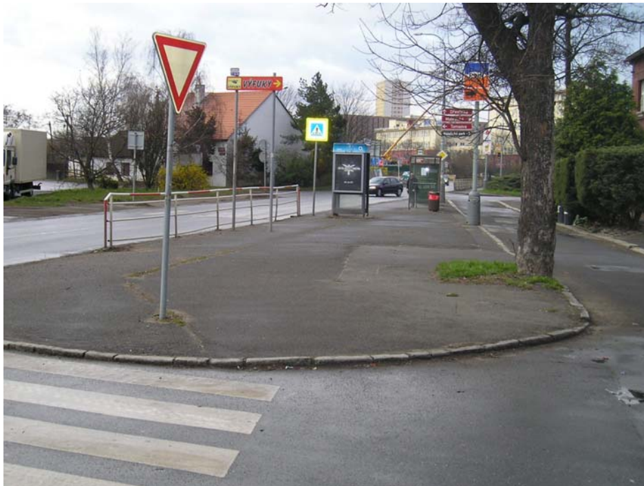
Obr. 1 – Zastávka „Malešické nám.“ (pohled ze severovýchodu)

Dnešní Malešické nám. je z dopravního hlediska pokračováním ul. U tvrze a navazuje na ně Dřevčická ul. Zastávka autobusů Dopravního podniku hl. m. Prahy směrem na jihozápad (a dále Sídliště Malešice, Limuzská ul., Skalka) je součástí poměrně frekventované vozovky. Zastavuje zde několik poměrně „silných“ linek (s krátkými intervaly). Pokud autobus(y) zastaví na zastávce, musí zůstat stát i auta za ním. Předjetí autobusu je obtížné pro silný provoz v protisměru a špatný výhled. Stojící auta často blokují i křižovatku ul. U Tvrze s ul. U univerzitního statku a Tomsovou ul. a v koloně musí vyčkávat i další autobusy DPP přijíždějící od Hrdlořez. V bezprostředním sousedství zastávky na západní straně náměstí je před domy č. 3 až 5 úzká manipulační jednosměrná vozovka a poté ostrůvek, na kterém je prostor nástupiště autobusů DPP (obr. 1 až 3).