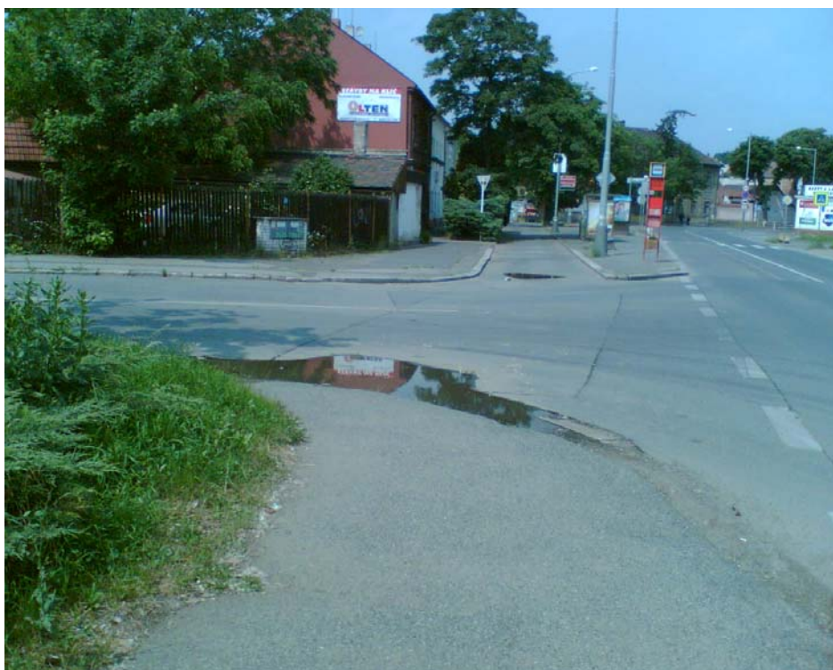
Obr. 3 – Chybějící přechod na Malešické ul. (pohled z opačné strany)