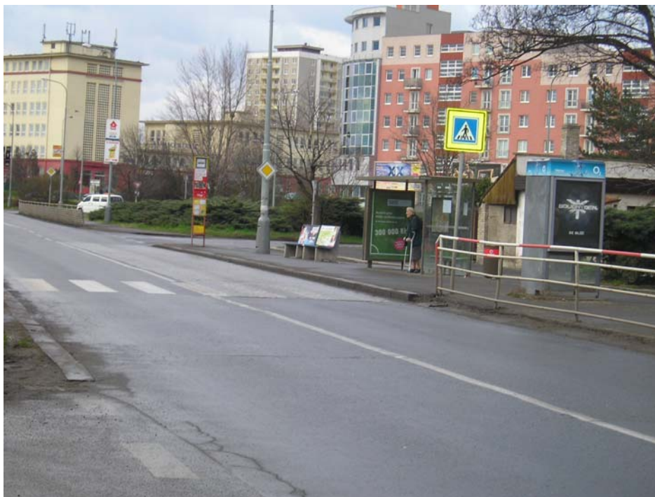
Obr. 2 – Zastávka „Malešické nám.“ (pohled z východu). Za ní je vidět vyústění Malešické ul. s chybějícím přechodem pro chodce.