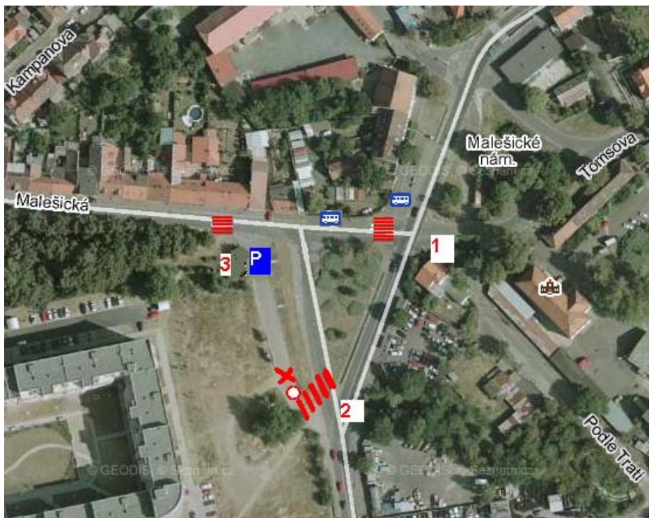
Obr. 1 – Plánek oblasti s vyznačením navrhovaného stavu

Dnešní Malešické nám. a na něj vedoucí Malešická a Dřevčická ul. tvoří oblast mezi starou zástavbou Malešic (včetně nových obytných zón) a sídlištěm Malešice, resp. oblastí Počernické ul. s mnoha obchody a objekty služeb. Denně touto oblastí procházejí stovky chodců do obchodů (ve starých Malešicích nejsou vůbec obchody potravinami). Dále pak děti do škol na sídlišti i mnozí obyvatelé na zastávku MHD Sídlíště Malešice. Dřevčická ul. je silně frekventovaná (spojnice Strašnic a Hrdlořez) a v souvislosti s výstavbou Malešické stráně značně stoupl i počet vozidel využívajících Malešickou ul. Od Malešického nám. směrem k Počernické ul. nelze podél Dřevčické ulice (po její jihozápadní straně) chodit pěšky. Nejsou zde upravené chodníky a na těch neupravených parkují (jsou vystavené bez souhlasu příslušných úřadů) automobily z blízkých autobazarů. Na opačné straně vozovky (vpravo ve směru od Malešického nám.) je sice asfaltový chodník, oddělený od vozovky zábradlím (i s ochranou proti rozstříkované vodě), ale na jeho začátku i konci schází přechod. (Pozice 1 a 2 na obr. 1 a obr. 2, 3 a 4).