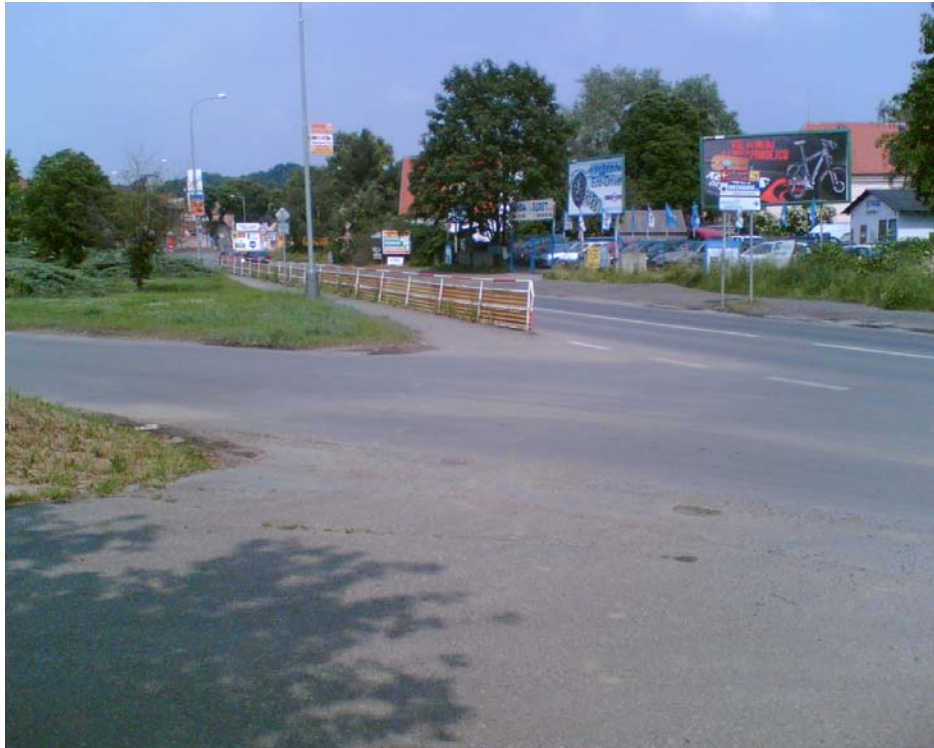
Obr. 4 – Chybějící přechod na vozovce mezi Malešickou a Dřevčickou ul.