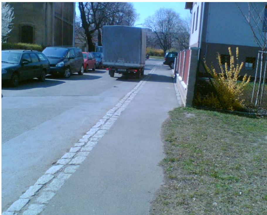
Obr. 5 – Jeden z kolizních úseků – vyústění Tomsovy ul. na Malešické nám.