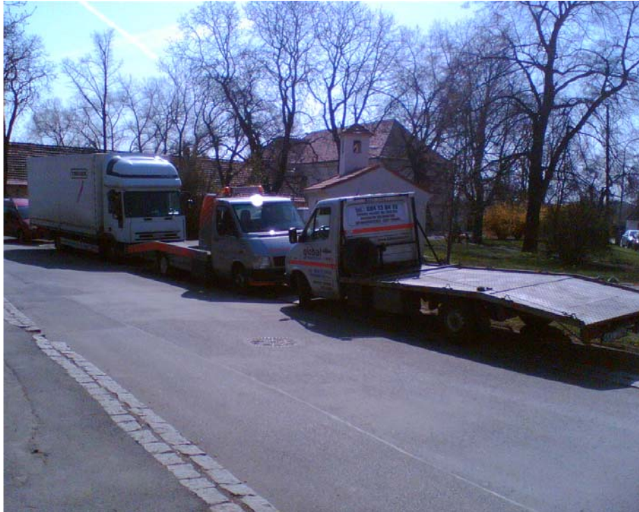
Obr. 2 – Památkově chráněná kaple v zajetí odtahové služby