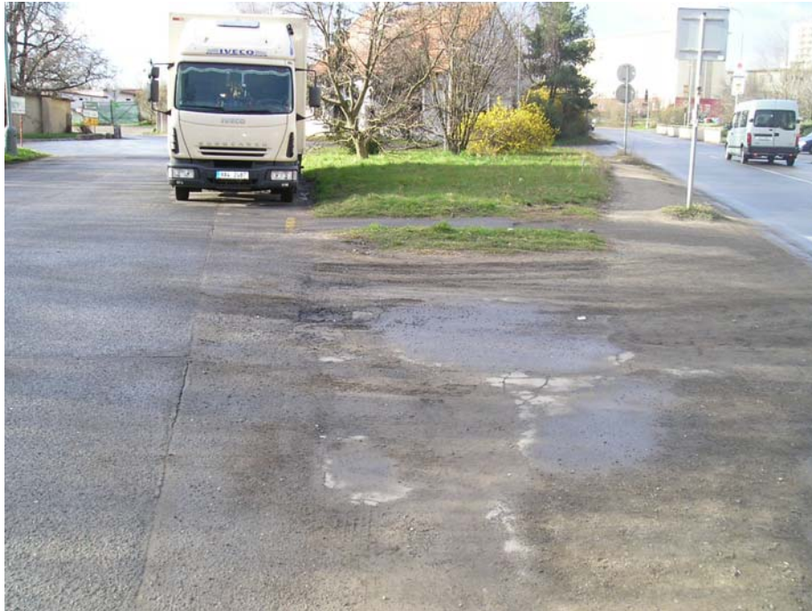
Obr. 4 – Bývalá část parčíku