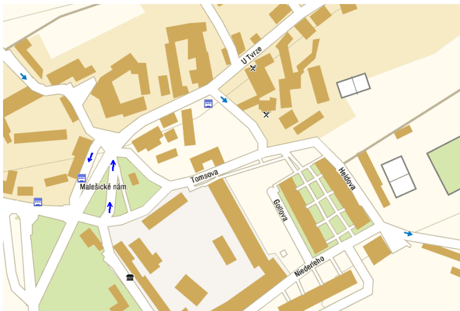
Obr. 1 – Stávající stav organizace dopravy (není zakreslena Ungarova ul.)