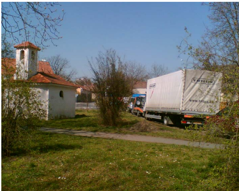
Obr. 3 – Památkově chráněná kaple v zajetí odtahové služby